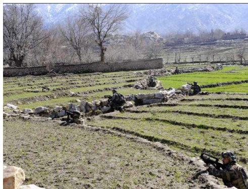
En vallée d'Alasaï