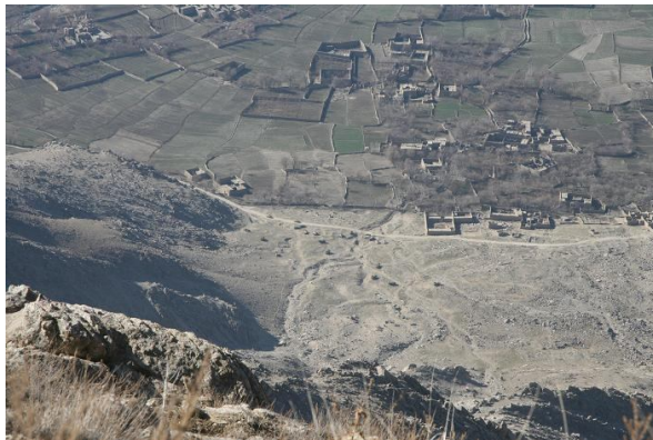
Vue sur la vallée