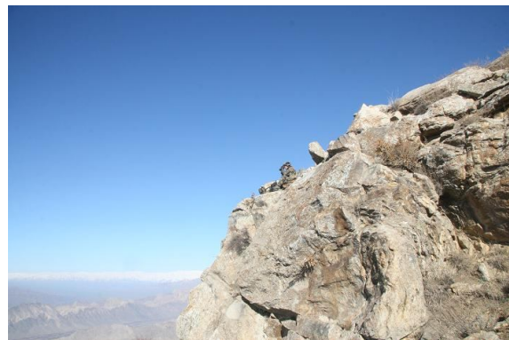
Un poste d'observation