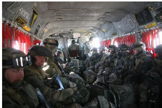
Capacité 30 hommes