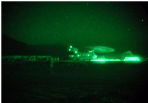
Embarquement de nuit ....

Le point clé de cette opération était le transport par hélicoptère et la dépose par surprise d'une compagnie du GTIA sur les hauteurs Nord de la vallée de Bédraou au moment même où une autre compagnie débouchait en Véhicules Blindés Haute Mobilité ( VBHM ) dans le fond de la vallée .