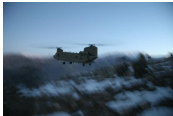
Le chinook en vol